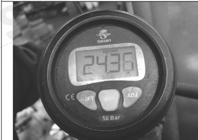
照片 E：測試中壓力表顯示