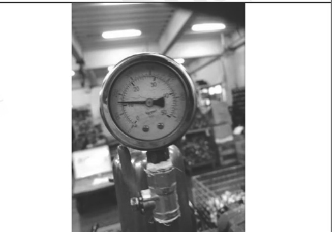
照片 F：測試中壓力表顯示

此報告是本公司依照背面所印之通用服務條款所簽發，此條款可在本公司網站 http://www.sgs.com.tw/Terms-and-Conditions 閱覽，凡電子文件之格式依 http://www.sgs.com.tw/Terms-and-Conditions 之電子文件期限與條件處理。請注意條款有關於責任、賠償之限制及管轄權的約定。任何持有此文件者，請注意本公司製作之結果報告書將僅反映執行時所紀錄且於接受指示範圍內之事實。本公司僅對客戶負責，此文件不妨礙當事人在交易上權利之行使或義務之免除。未經本公司事先書面同意，此報告不可部份複製。任何未經授權的變更、偽造、或曲解本報告所顯示之內容，皆為不合法，違犯者可能遭受法律上最嚴厲之追訴。除非另有說明，此報告結果僅對測試之樣品負責。