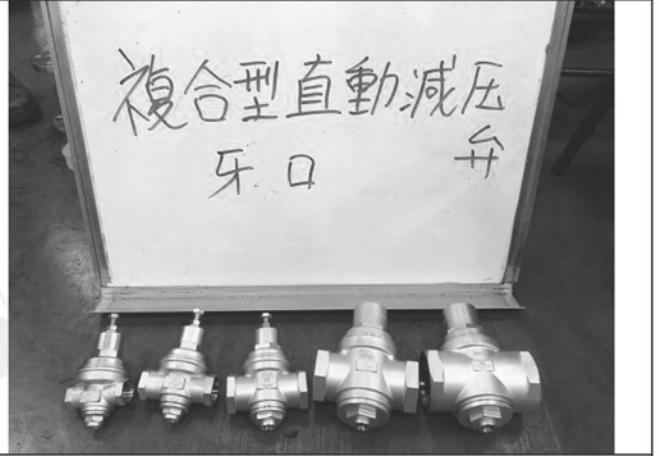
照片 B：測試樣品外觀 複合型-直動減壓閥(牙口)