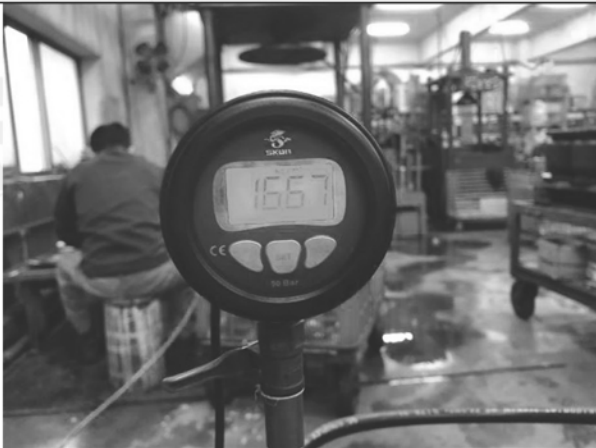
照片 C：測試中水壓表顯示