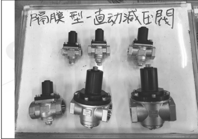
照片 A：測試樣品外觀