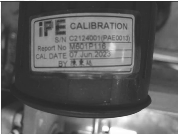
照片 E：水壓表校正標籤