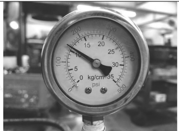
照片 D：測試中水壓表顯示