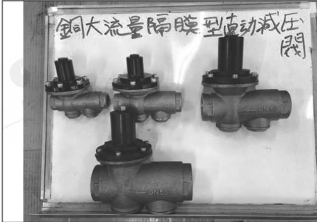
照片 A：測試樣品外觀