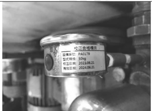
照片 F：水壓表校正標籤