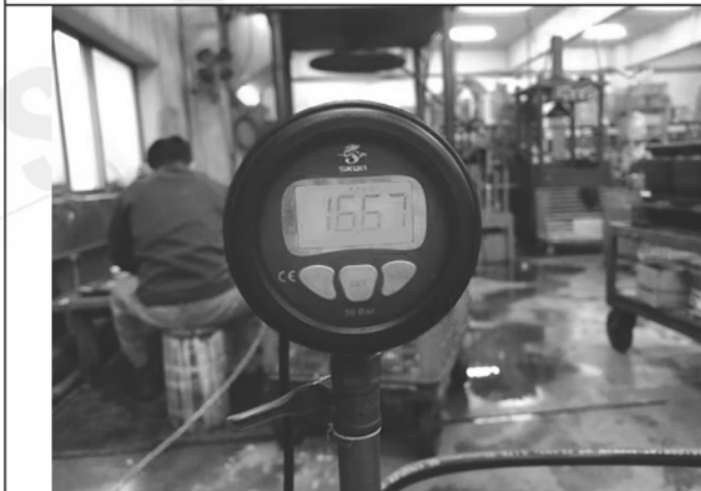
照片 C：測試中水壓表顯示