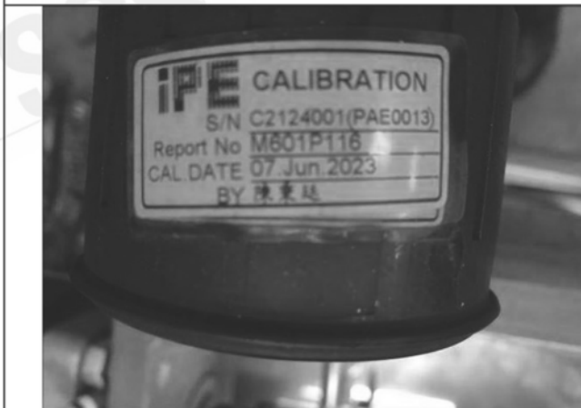
照片 E：水壓表校正標籤