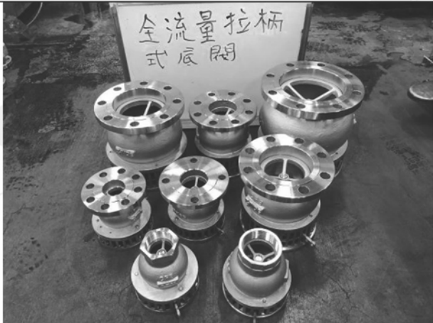
照片 A：測試樣品外觀