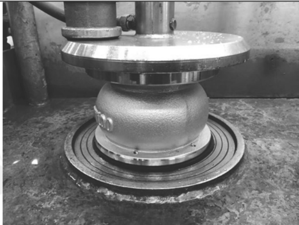
照片 B：測試架設 (閥體耐壓測試)