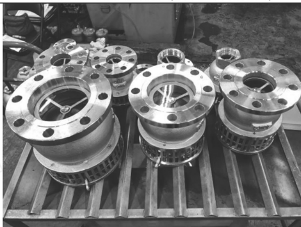
照片 D：測試架設 (閥門功能測試)