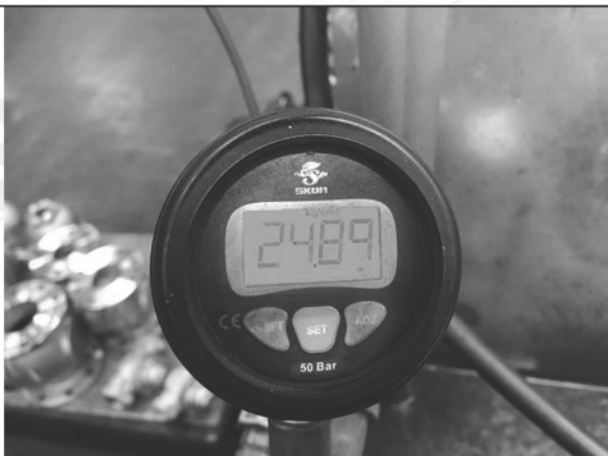
照片 C：測試中水壓表顯示