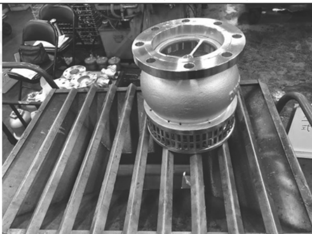
照片 E：測試架設 (閥門功能測試)