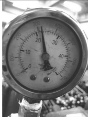
照片 D：測試中水壓表顯示