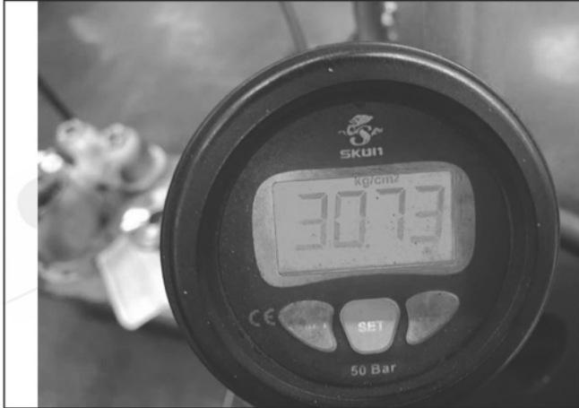
照片 C：測試中水壓表顯示