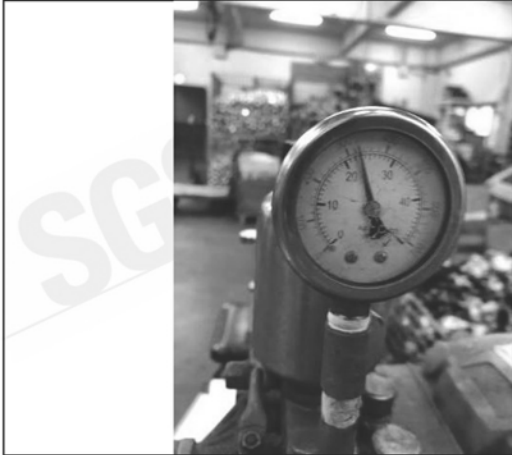
照片 G：測試中水壓表顯示