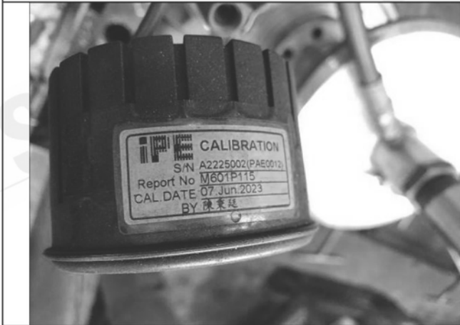
照片 I：水壓表校正標籤