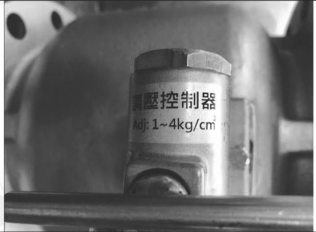
照片 H：樣品近照 (調壓控制器)