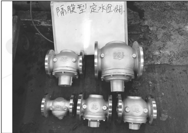
照片 A：測試樣品外觀 (法蘭)