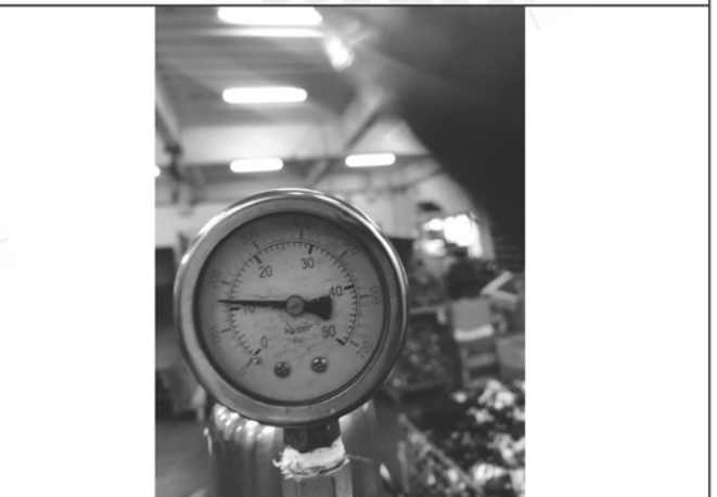
照片 F：測試中水壓表顯示

此報告是本公司依照背面所印之通用服務條款所簽發，此條款可在本公司網站 http://www.sgs.com.tw/Terms-and-Conditions 閱覽，凡電子文件之格式依 http://www.sgs.com.tw/Terms-and-Conditions 之電子文件期限與條件處理。請注意條款有關於責任、賠償之限制及管轄權的約定。任何持有此文件者，請注意本公司製作之結果報告書將僅反映執行時所紀錄且於接受指示範圍內之事實。本公司僅對客戶負責，此文件不妨礙當事人在交易上權利之行使或義務之免除。未經本公司事先書面同意，此報告不可部份複製。任何未經授權的變更、偽造、或曲解本報告所顯示之內容，皆為不合法，違犯者可能遭受法律上最嚴厲之追訴。除非另有說明，此報告結果僅對測試之樣品負責。