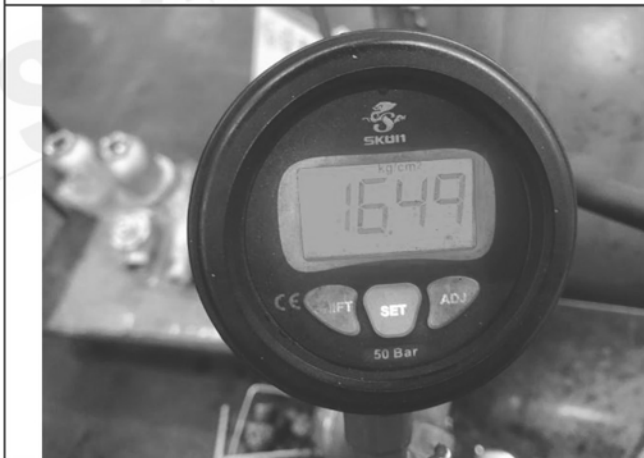
照片 E：測試中水壓表顯示