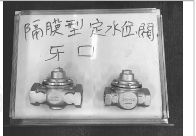
照片 B：測試樣品外觀 (牙口)