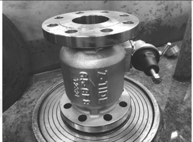
照片 B：測試樣品外觀 (DN65)BFS-65