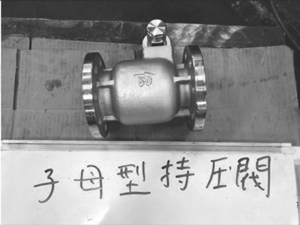
照片 A：測試樣品外觀 (DN50)BFS-50