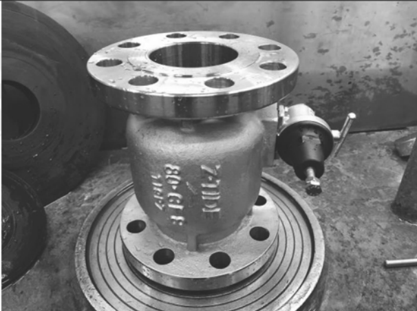
照片 C：測試樣品外觀 (DN80)BFS-80