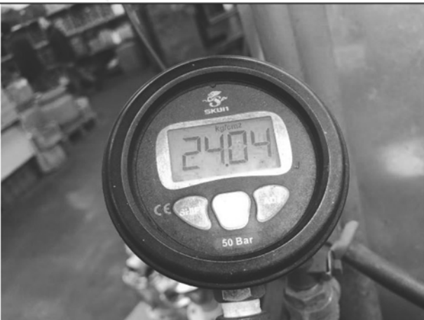
照片 K：測試中水壓表顯示