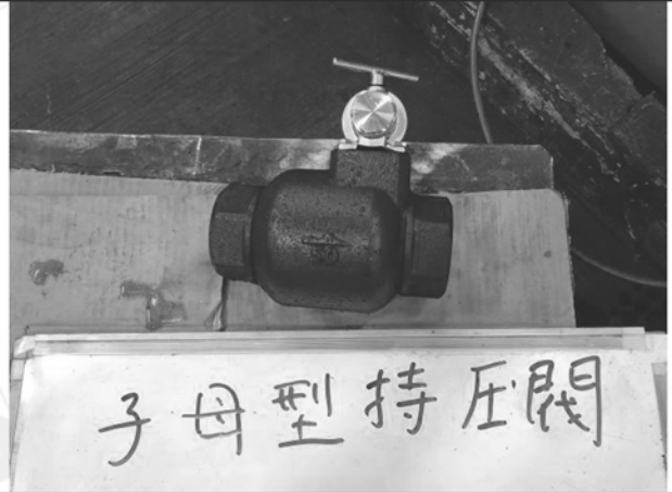
照片 H：測試樣品外觀 (DN50)BTS-50