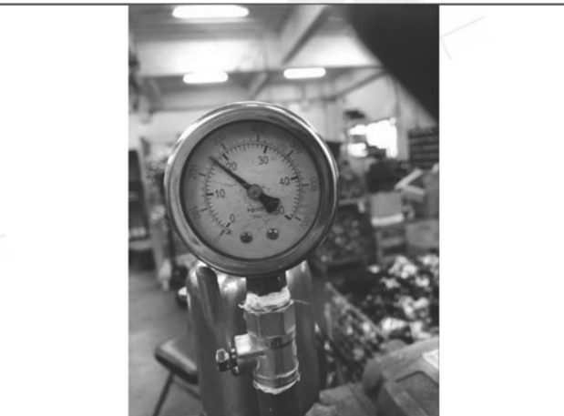
照片 L：測試中水壓表顯示

此報告是本公司依照背面所印之通用服務條款所簽發，此條款可在本公司網站 http://www.sgs.com.tw/Terms-and-Conditions 閱覽，凡電子文件之格式依 http://www.sgs.com.tw/Terms-and-Conditions 之電子文件期限與條件處理。請注意條款有關於責任、賠償之限制及管轄權的約定。任何持有此文件者，請注意本公司製作之結果報告書將僅反映執行時所紀錄且於接受指示範圍內之事實。本公司僅對客戶負責，此文件不妨礙當事人在交易上權利之行使或義務之免除。未經本公司事先書面同意，此報告不可部份複製。任何未經授權的變更、偽造、或曲解本報告所顯示之內容，皆為不合法，違犯者可能遭受法律上最嚴厲之追訴。除非另有說明，此報告結果僅對測試之樣品負責。