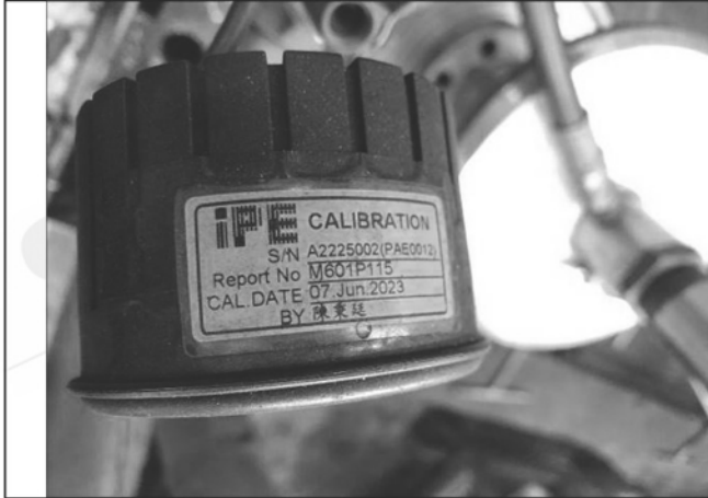
照片 M：水壓表校正標籤