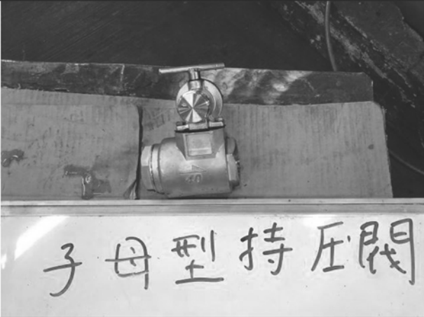
照片 G：測試樣品外觀 (DN40)BTS-40