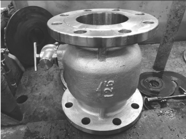
照片 E：測試樣品外觀 (DN125)BFS-125