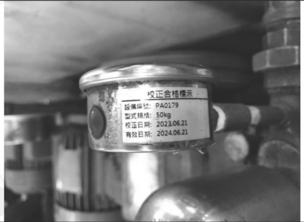
照片 N：水壓表校正標籤