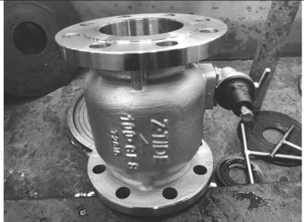
照片 D：測試樣品外觀 (DN100)BFS-100