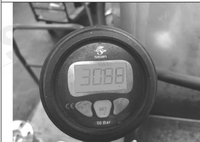
照片 K：測試中水壓表顯示