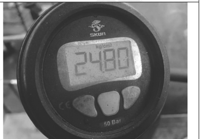
照片 L：測試中水壓表顯示

此報告是本公司依照背面所印之通用服務條款所簽發，此條款可在本公司網站 http://www.sgs.com.tw/Terms-and-Conditions 閱覽，凡電子文件之格式依 http://www.sgs.com.tw/Terms-and-Conditions 之電子文件期限與條件處理。請注意條款有關於責任、賠償之限制及管轄權的約定。任何持有此文件者，請注意本公司製作之結果報告書將僅反映執行時所紀錄且於接受指示範圍內之事實。本公司僅對客戶負責，此文件不妨礙當事人在交易上權利之行使或義務之免除。未經本公司事先書面同意，此報告不可部份複製。任何未經授權的變更、偽造、或曲解本報告所顯示之內容，皆為不合法，違犯者可能遭受法律上最嚴厲之追訴。除非另有說明，此報告結果僅對測試之樣品負責。