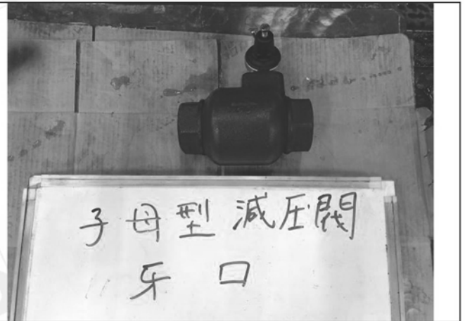
照片 H：測試樣品外觀 (DN50)BTR-50