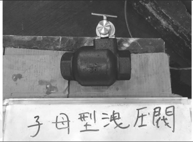
照片 H：測試樣品外觀 (DN50)BTL-50