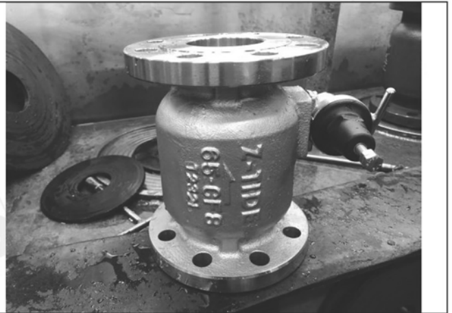
照片 B：測試樣品外觀 (DN65)BFL-65