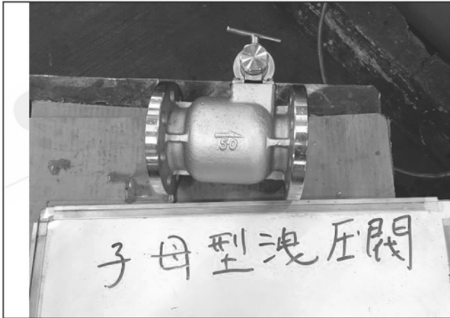
照片 A：測試樣品外觀 (DN50)BFL-50