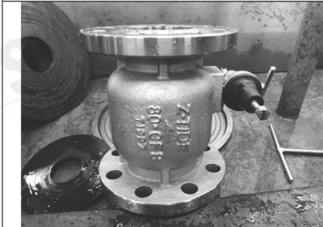
照片 C：測試樣品外觀 (DN80)BFL-80