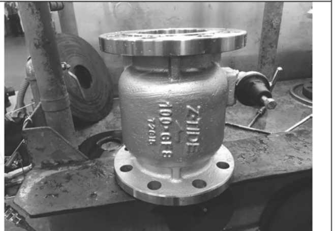
照片 D：測試樣品外觀 (DN100)BFL-100