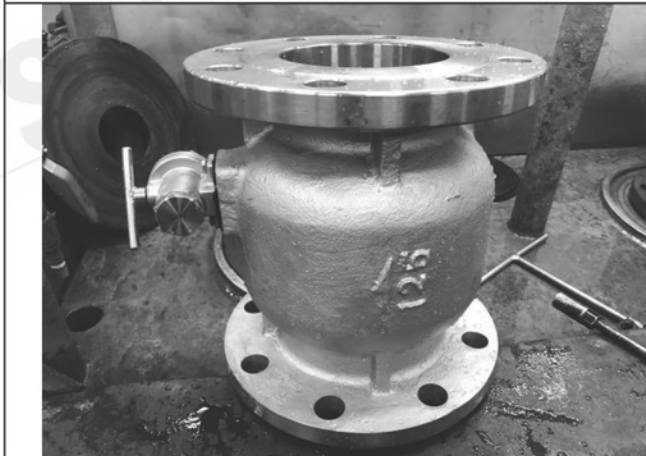
照片 E：測試樣品外觀 (DN125)BFL-125