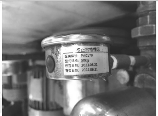
照片 N：水壓表校正標籤