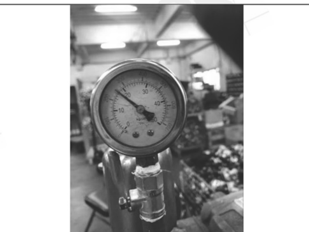
照片 L：測試中水壓表顯示

此報告是本公司依照背面所印之通用服務條款所簽發，此條款可在本公司網站 http://www.sgs.com.tw/Terms-and-Conditions 閱覽，凡電子文件之格式依 http://www.sgs.com.tw/Terms-and-Conditions 之電子文件期限與條件處理。請注意條款有關於責任、賠償之限制及管轄權的約定。任何持有此文件者，請注意本公司製作之結果報告書將僅反映執行時所紀錄且於接受指示範圍內之事實。本公司僅對客戶負責，此文件不妨礙當事人在交易上權利之行使或義務之免除。未經本公司事先書面同意，此報告不可部份複製。任何未經授權的變更、偽造、或曲解本報告所顯示之內容，皆為不合法，違犯者可能遭受法律上最嚴厲之追訴。除非另有說明，此報告結果僅對測試之樣品負責。