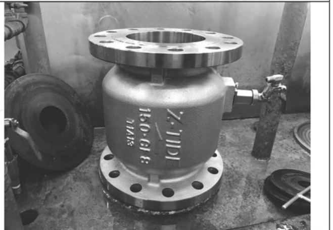
照片 F：測試樣品外觀 (DN150)BFF-150

此報告是本公司依照背面所印之通用服務條款所簽發，此條款可在本公司網站 http://www.sgs.com.tw/Terms-and-Conditions 閱覽，凡電子文件之格式依 http://www.sgs.com.tw/Terms-and-Conditions 之電子文件期限與條件處理。請注意條款有關於責任、賠償之限制及管轄權的約定。任何持有此文件者，請注意本公司製作之結果報告書將僅反映執行時所紀錄且於接受指示範圍內之事實。本公司僅對客戶負責，此文件不妨礙當事人在交易上權利之行使或義務之免除。未經本公司事先書面同意，此報告不可部份複製。任何未經授權的變更、偽造、或曲解本報告所顯示之內容，皆為不合法，違犯者可能遭受法律上最嚴厲之追訴。除非另有說明，此報告結果僅對測試之樣品負責。