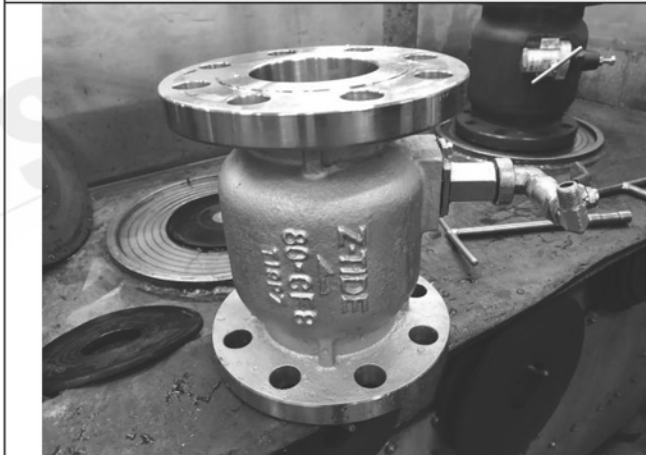
照片 C：測試樣品外觀 (DN80)BFF-80