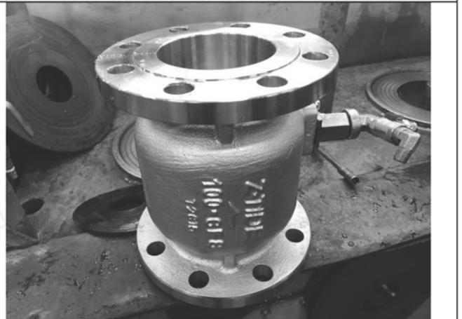
照片 D：測試樣品外觀 (DN100)BFF-100