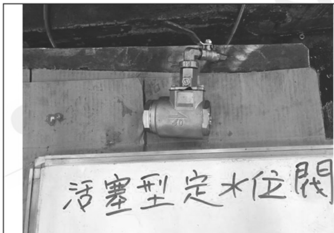
照片 G：測試樣品外觀 (DN40)BTF-40