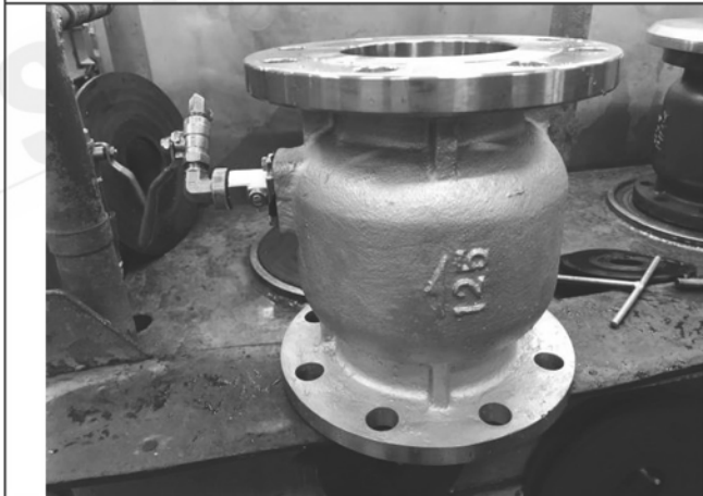
照片 E：測試樣品外觀 (DN125)BFF-125