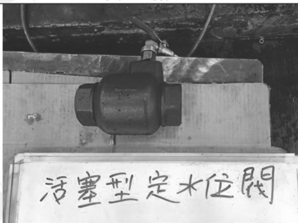
照片 H：測試樣品外觀 (DN50)BTF-50