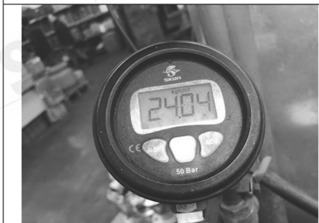
照片 K：測試中水壓表顯示