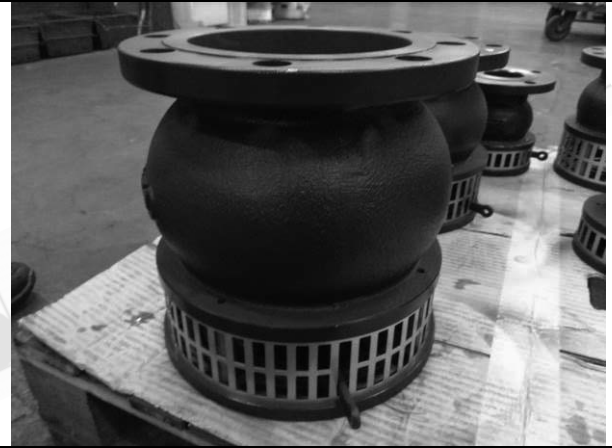
照片 B：測試樣品外觀 (近照)