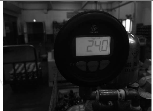
照片 D：測試中壓力表顯示