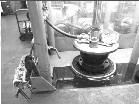
照片 C：測試架設 (閥體耐壓測試)