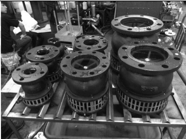
照片 E：測試架設 (閥門功能測試)