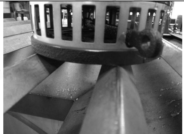
照片 F：測試架設 (閥門功能測試)