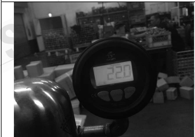
照片 G：測試中壓力表顯示