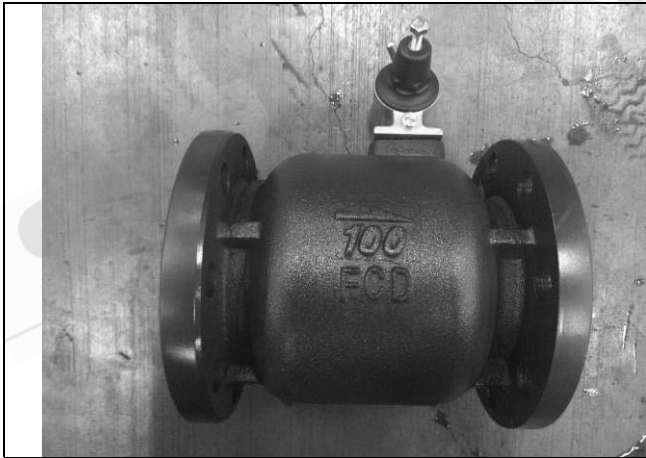
照片 C：測試樣品外觀 (DN100)FFR-100