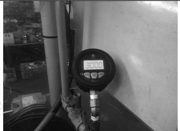
照片 F：測試中壓力表顯示