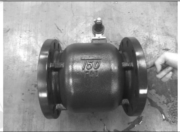
照片 D：測試樣品外觀 (DN150)FFR-150