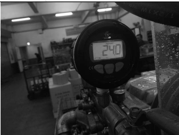
照片 K：測試中壓力表顯示