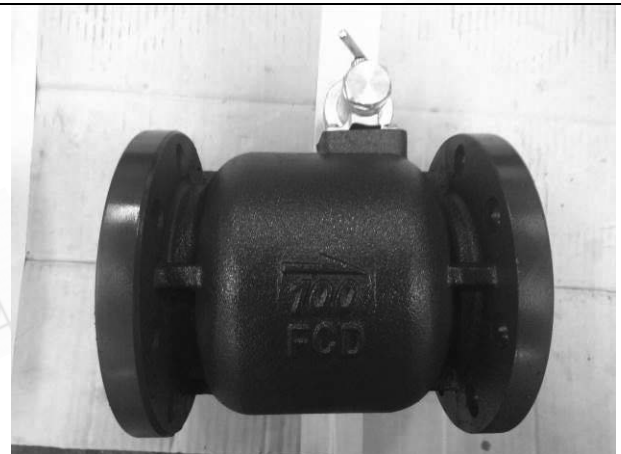
照片 D：測試樣品外觀 (DN100)BFS-100