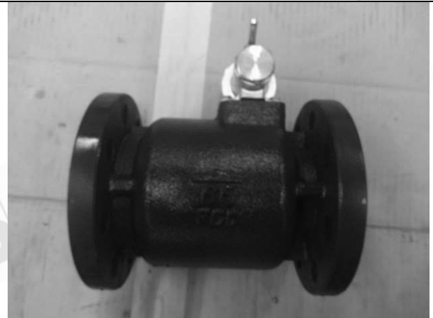
照片 B：測試樣品外觀 (DN65)BFS-65