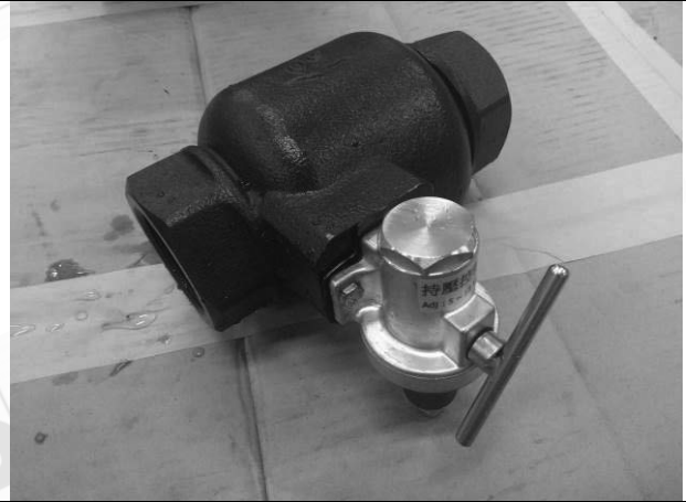
照片 H：測試樣品外觀 (DN50)BTS-50