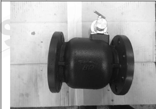
照片 C：測試樣品外觀 (DN80)BFS-80