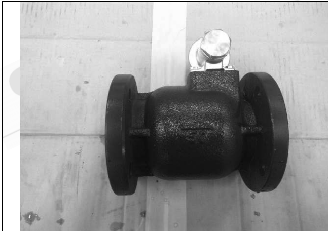
照片 A：測試樣品外觀 (DN50)BFS-50