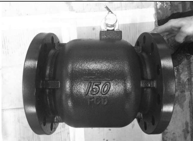
照片 F：測試樣品外觀 (DN150)BFS-150

此報告是本公司依照背面所印之通用服務條款所簽發，此條款可在本公司網站 http://www.sgs.com/en/Terms-and-Conditions.aspx 閱覽，凡電子文件之格式依 http://www.sgs.com/en/Terms-and-Conditions/Terms-e-Document.aspx 之電子文件期限與條件處理。請注意條款有關於責任、賠償之限制及管轄權的約定。任何持有此文件者，請注意本公司製作之結果報告書將僅反映執行時所紀錄且於接受指示範圍內之事實。本公司僅對客戶負責，此文件不妨礙當事人在交易上權利之行使或義務之免除。未經本公司事先書面同意，此報告不可部份複製。任何未經授權的變更、偽造、或曲解本報告所顯示之內容，皆為不合法，違犯者可能遭受法律上最嚴厲之追訴。除非另有說明，此報告結果僅對測試之樣品負責。