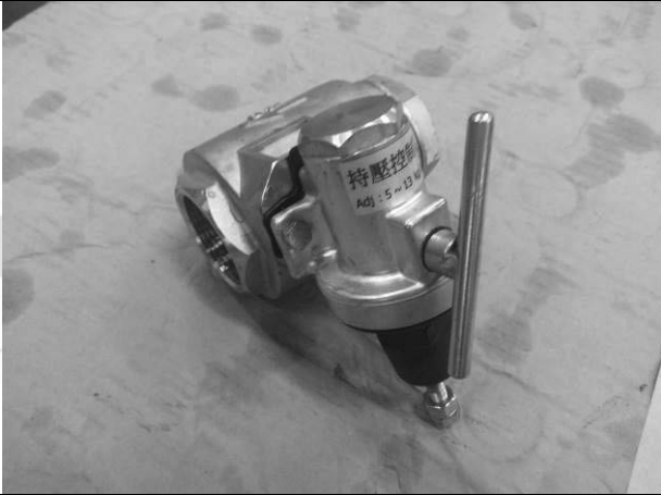
照片 G：測試樣品外觀 (DN40)BTS-40