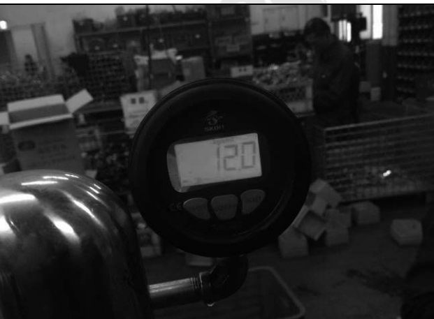
照片 L：測試中壓力表顯示

此報告是本公司依照背面所印之通用服務條款所簽發，此條款可在本公司網站 http://www.sgs.com/en/Terms-and-Conditions.aspx 閱覽，凡電子文件之格式依 http://www.sgs.com/en/Terms-and-Conditions/Terms-e-Document.aspx 之電子文件期限與條件處理。請注意條款有關於責任、賠償之限制及管轄權的約定。任何持有此文件者，請注意本公司製作之結果報告書將僅反映執行時所紀錄且於接受指示範圍內之事實。本公司僅對客戶負責，此文件不妨礙當事人在交易上權利之行使或義務之免除。未經本公司事先書面同意，此報告不可部份複製。任何未經授權的變更、偽造、或曲解本報告所顯示之內容，皆為不合法，違犯者可能遭受法律上最嚴厲之追訴。除非另有說明，此報告結果僅對測試之樣品負責。