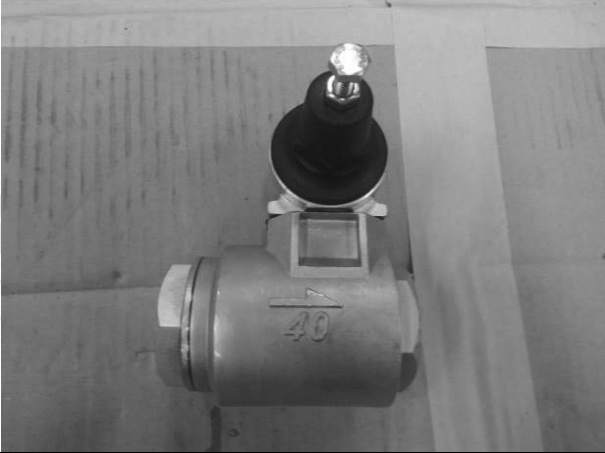
照片 G：測試樣品外觀 (DN40)BTR-40