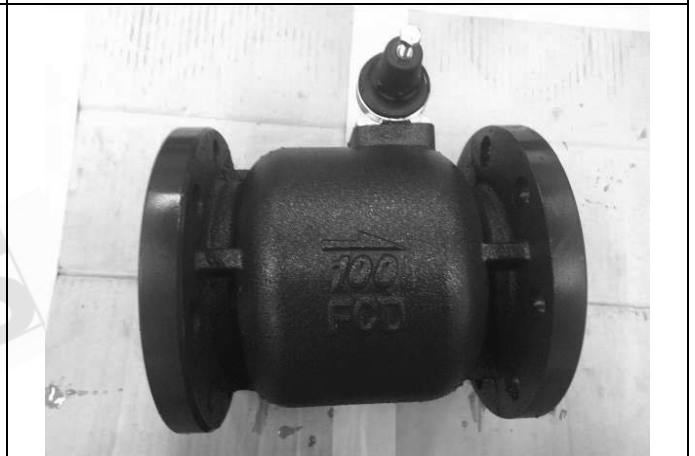
照片 D：測試樣品外觀 (DN100)BFR-100