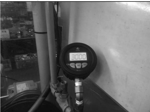
照片 K：測試中壓力表顯示