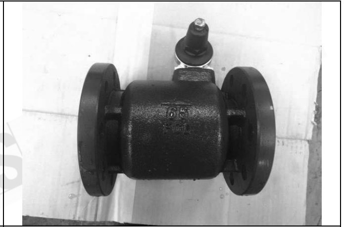
照片 B：測試樣品外觀 (DN65)BFR-65