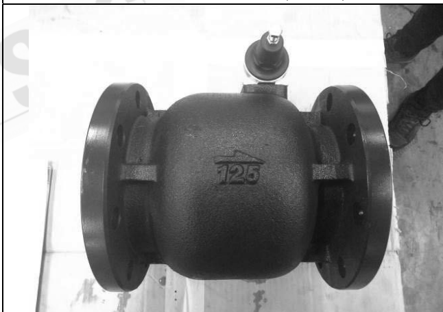
照片 E：測試樣品外觀 (DN125)BFR-125