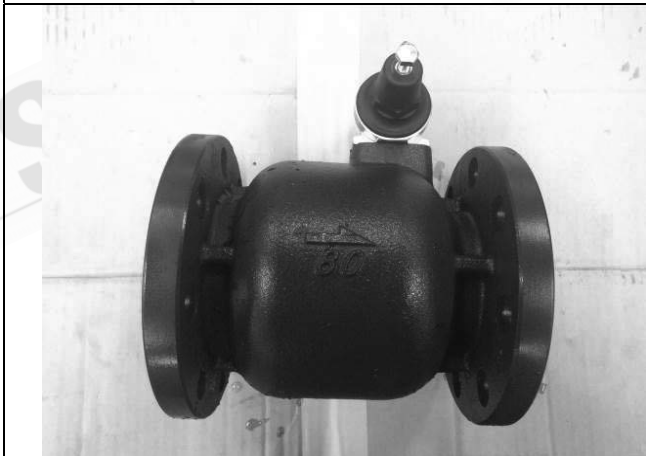
照片 C：測試樣品外觀 (DN80)BFR-80