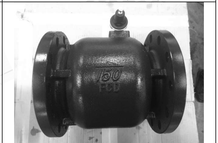
照片 F：測試樣品外觀 (DN150)BFR-150

此報告是本公司依照背面所印之通用服務條款所簽發，此條款可在本公司網站 http://www.sgs.com/en/Terms-and-Conditions.aspx 閱覽，凡電子文件之格式依 http://www.sgs.com/en/Terms-and-Conditions/Terms-e-Document.aspx 之電子文件期限與條件處理。請注意條款有關於責任、賠償之限制及管轄權的約定。任何持有此文件者，請注意本公司製作之結果報告書將僅反映執行時所紀錄且於接受指示範圍內之事實。本公司僅對客戶負責，此文件不妨礙當事人在交易上權利之行使或義務之免除。未經本公司事先書面同意，此報告不可部份複製。任何未經授權的變更、偽造、或曲解本報告所顯示之內容，皆為不合法，違犯者可能遭受法律上最嚴厲之追訴。除非另有說明，此報告結果僅對測試之樣品負責。