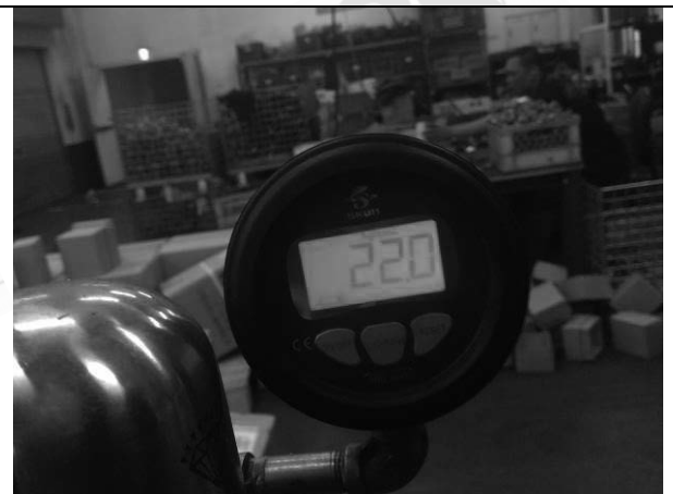
照片 L：測試中壓力表顯示

此報告是本公司依照背面所印之通用服務條款所簽發，此條款可在本公司網站 http://www.sgs.com/en/Terms-and-Conditions.aspx 閱覽，凡電子文件之格式依 http://www.sgs.com/en/Terms-and-Conditions/Terms-e-Document.aspx 之電子文件期限與條件處理。請注意條款有關於責任、賠償之限制及管轄權的約定。任何持有此文件者，請注意本公司製作之結果報告書將僅反映執行時所紀錄且於接受指示範圍內之事實。本公司僅對客戶負責，此文件不妨礙當事人在交易上權利之行使或義務之免除。未經本公司事先書面同意，此報告不可部份複製。任何未經授權的變更、偽造、或曲解本報告所顯示之內容，皆為不合法，違犯者可能遭受法律上最嚴厲之追訴。除非另有說明，此報告結果僅對測試之樣品負責。