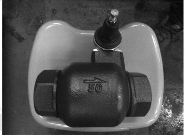
照片 H：測試樣品外觀 (DN50)BTR-50