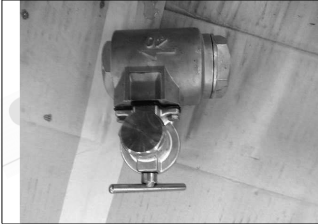
照片 G：測試樣品外觀 (DN40)BTL-40