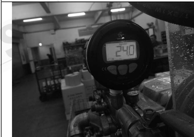
照片 K：測試中壓力表顯示