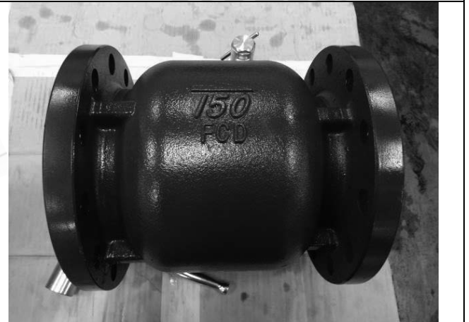
照片 F：測試樣品外觀 (DN150)BFL-150

此報告是本公司依照背面所印之通用服務條款所簽發，此條款可在本公司網站 http://www.sgs.com/en/Terms-and-Conditions.aspx 閱覽，凡電子文件之格式依 http://www.sgs.com/en/Terms-and-Conditions/Terms-e-Document.aspx 之電子文件期限與條件處理。請注意條款有關於責任、賠償之限制及管轄權的約定。任何持有此文件者，請注意本公司製作之結果報告書將僅反映執行時所紀錄且於接受指示範圍內之事實。本公司僅對客戶負責，此文件不妨礙當事人在交易上權利之行使或義務之免除。未經本公司事先書面同意，此報告不可部份複製。任何未經授權的變更、偽造、或曲解本報告所顯示之內容，皆為不合法，違犯者可能遭受法律上最嚴厲之追訴。除非另有說明，此報告結果僅對測試之樣品負責。