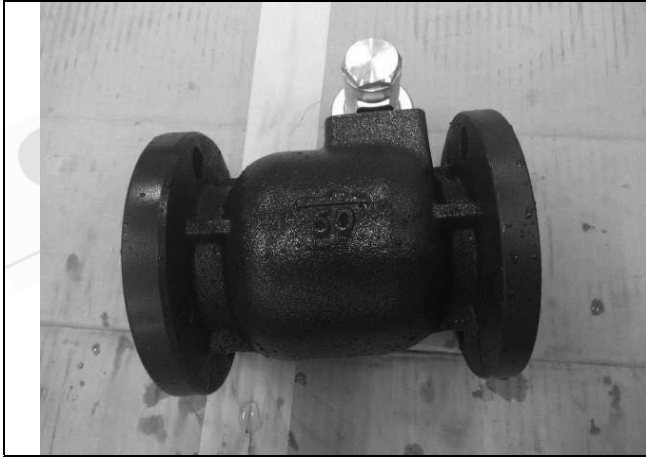
照片 A：測試樣品外觀 (DN50)BFL-50