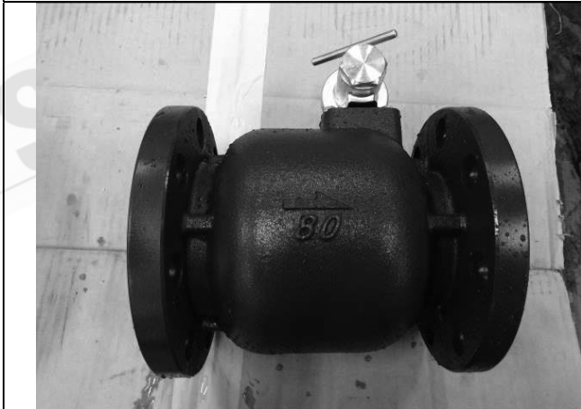
照片 C：測試樣品外觀 (DN80)BFL-80