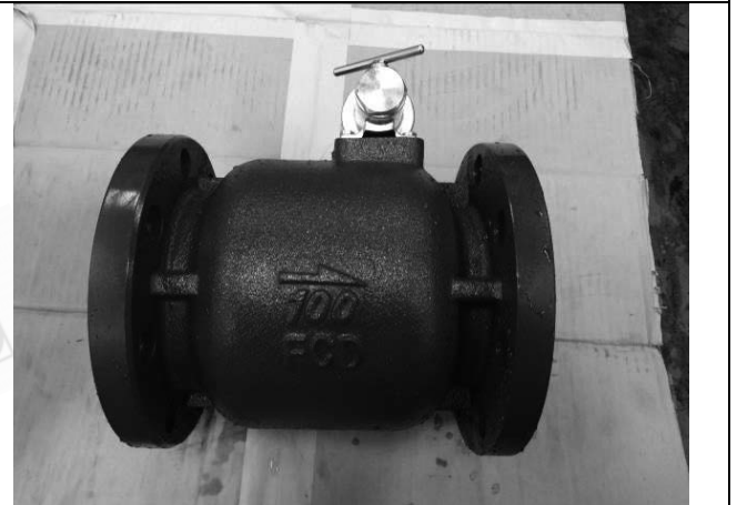
照片 D：測試樣品外觀 (DN100)BFL-100