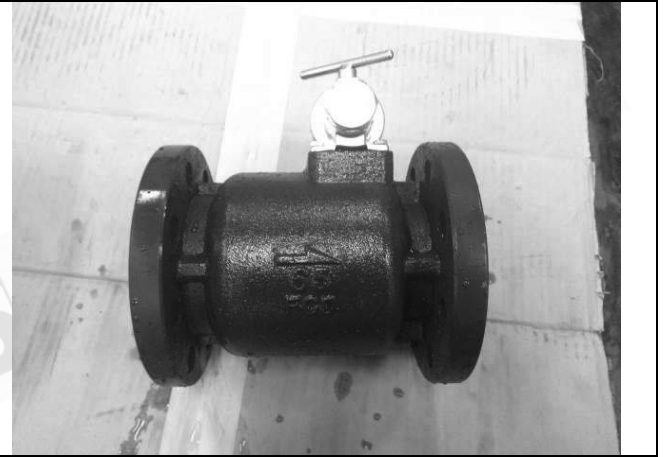
照片 B：測試樣品外觀 (DN65)BFL-65