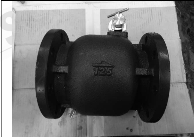
照片 E：測試樣品外觀 (DN125)BFL-125