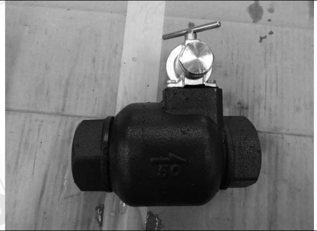
照片 H：測試樣品外觀 (DN50)BTL-50